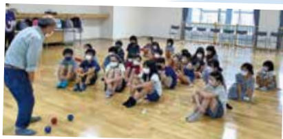
ペタンクでシニアクラブの方との交流