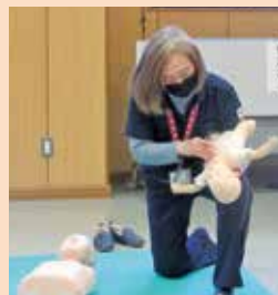
緊急救命の実技指導の様子

有料広告募集中!!企業のPRや商店の売り出し、イベントの案内などにご利用ください。(1枠2,000円~)