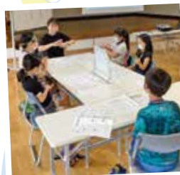
手話サークルによる手話体験