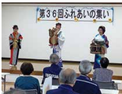
チンドンかわち家

高齢者配食サービスに登録されている方を対象に「ふれあいの集い」を開催しました。かわち家さんによる楽しく元気になるステージ、つくしんぼコーラスさんによる素晴らしい歌声が響きわたり、楽しいひと時を過ごされました。