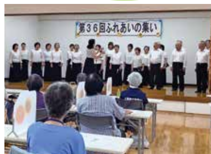
つくしんぼコーラス