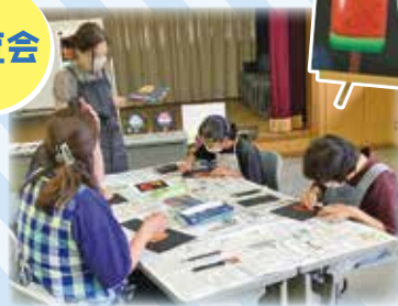
「チョークアート」講座

会員向け交流会を 年2回行っています。 会員同士の色々な意見を 聞くことができる機会と なっています。