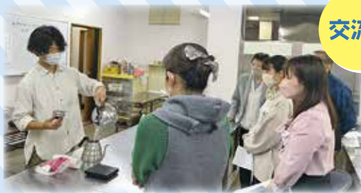
「美味しいコーヒーの淹れ方」講座