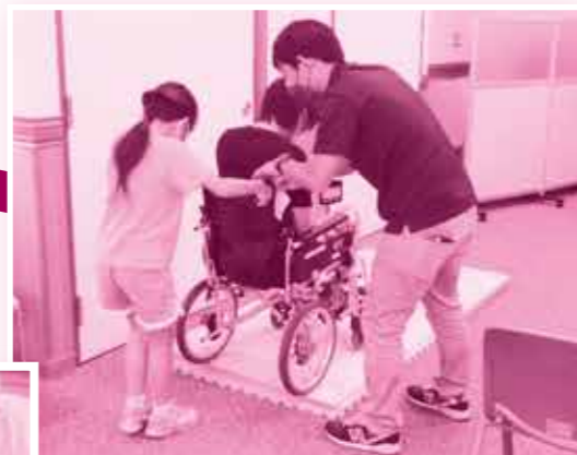
障害物をのりこえて♪