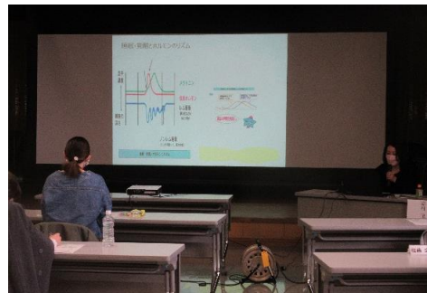
子供とのかかわり方について