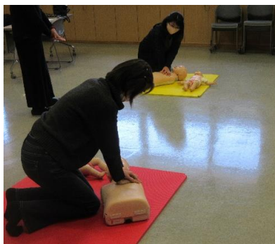
子供におきやすい事故と 予防の手当て